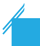
Светло-синий C70 M15 Y0 K0